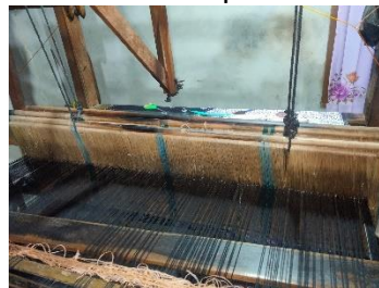
Gambar. 11 Karap