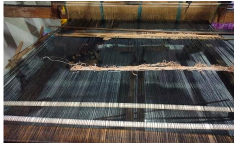
Gambar. 13 Bom dimasukkan ke dalam rumah kik