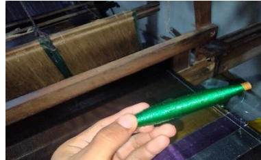
Gambar. 15 Palet