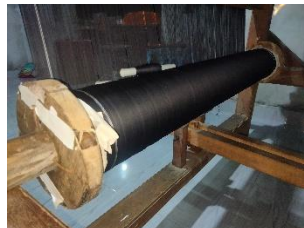
Gambar. 10 Bom