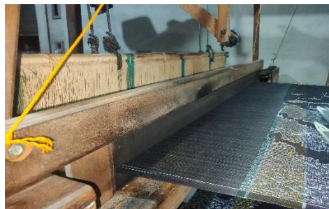
Gambar. 18 Coban