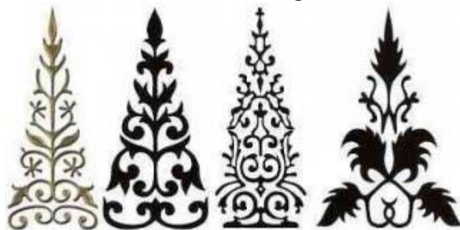
Gambar. 6 Pucuk Rebung

Nilai tahu diri tercermin dalam motif songket corak bulan penuh, kaluk pakis, dan corak awan larat. Nilai tahu diri sangat penting untuk dimiliki. Apalagi ketika kita pergi merantau atau datang ke tempat yang bukan daerahnya. Dalam artian tidak semena-mena, tahu akan adab serta sopan santun dalam bertingkah laku ditempat orang. Harapan baik tercermin dalam motif pucuk rebung, yang melambangkan bahwa orang Melayu itu tidak mudah jatuh walaupun tertimpa angin atau masalah yang berat. Hal ini dikarenakan orang Melayu memiliki pedoman kuat yang dilambangkan dengan akar pucuk rebung yang besar.