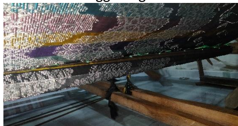
Gambar. 14 Penggulung kain