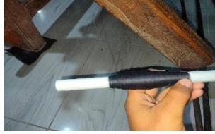
Gambar. 7 Paralon