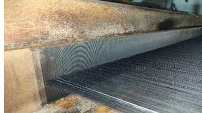
Gambar. 12 Sisir