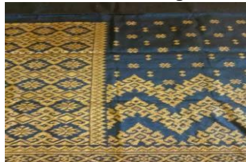
Gambar. 4 Siku Keluang

Orang melayu adalah orang yang menjunjung tinggi kepahlawanan yang dibuktikan dalam ungkapan “esa hilang dua terbilang, pantang melayu hilang dibumi” atau ungkapan yang paling familiar didengar oleh kita adalah “sekali layar terkembang, pantang berbalik pulang”. Motif yang mencerminkan nilai kepahlawanan adalah naga berjuang, naga bertangkap, garuda menyambar, ayam jantan, siku keluang dsb.